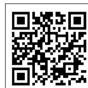
中札内村立診療所 公式HP

出身大学は日本大学、出身地は栃木県です。趣味は旅行やランニングです。この度北海道の大地で働くことを心待ちにしておりました。人と人とのつながりを大切にしていきながら、地域の皆様にそっと手を差し伸べられるような医師を目指し、日々尽力してまいります。未熟な部分が多々ございますが、精一杯頑張っていきますのでよろしくお願いいたします。