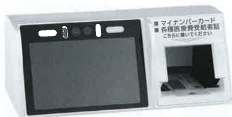
カード読取機 2022年12月設置予定

健康保険証と連携したマイナンバーカードで患者様のデータを読み込むことで、簡単に本人確認が出来るようになります。受付時間の短縮、保険証・診察券等が不要、お薬手帳の役割も果たし他院との重複投薬がないかを確認できるようなするなど、メリットが大きいです。